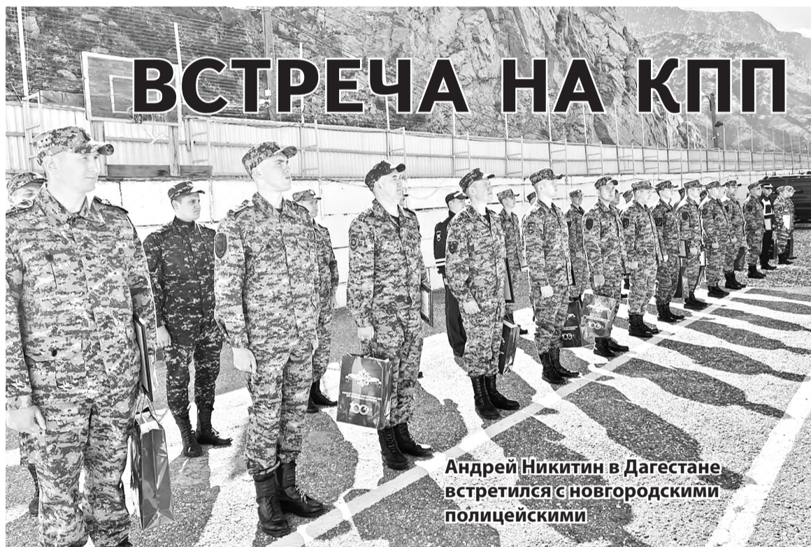
Андрей Никитин в Дагестане встретился с новгородскими полицейскими