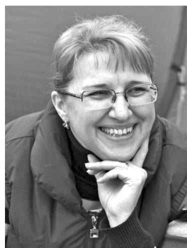
Родилась в г. Рига. Долгое время жила в Санкт-Петербурге. Член литературного клуба «Свеча» (Боровичи) и Боровичского ЛИТО. Автор книг «Любовь и обнажение», «Книга в журнале «Русский писатель», «Право на небо», «В руках любви», «Мелодия Эха», «Босиком», «Вполборота».